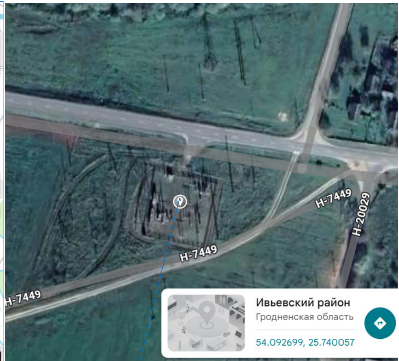
ПС 35 кВ «Субботники» с подъездной автодорогой